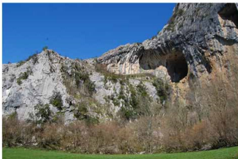
Boca Cuevamur & Pared del Eco Punto de la ruta: 6 km