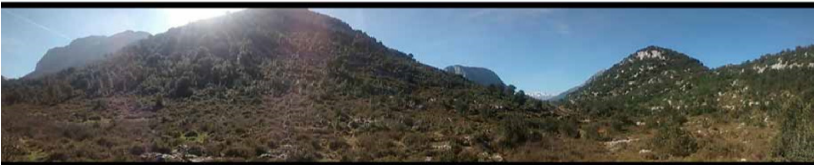
Valle del Silencio Punto de la ruta: 3,5 km