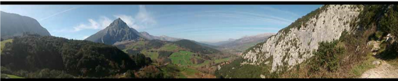
Mirador de Covalanas Punto de la ruta: 7 km

Restos del primer enterramiento del periodo Magdaleniense hallado en España