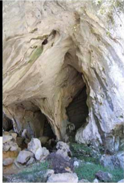
Atravesaremos la Cueva de la Luz Punto de la Ruta: 6 km