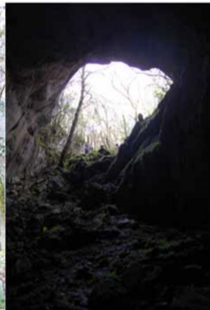
Boca Cueva de las Aguas Punto de la ruta: 2 km