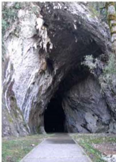
Boca Cueva Cullalvera Punto de la ruta: 0,5 km