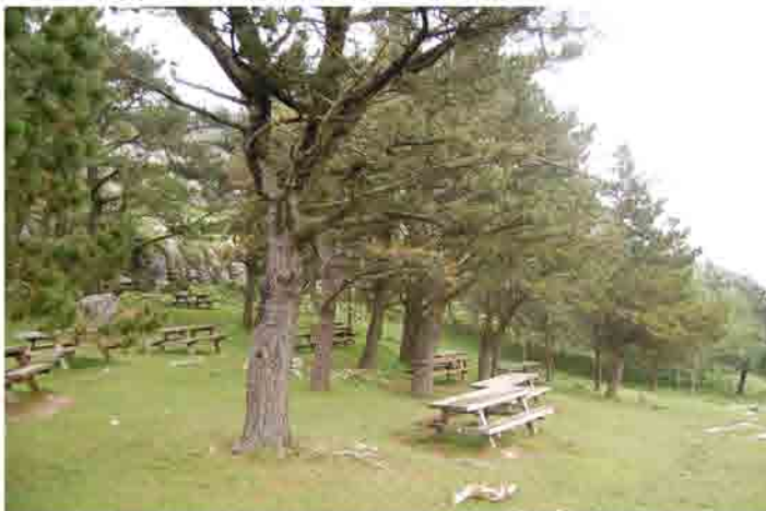
Parque de pinos Punto de la ruta: 6 km