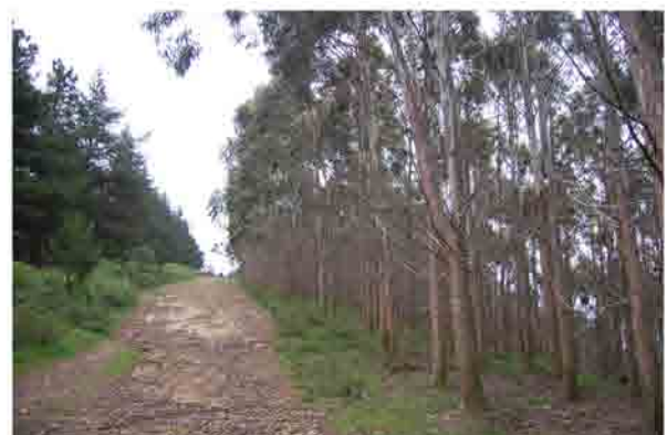
Pista entre pinos y eucaliptos Punto de la ruta: 4 km