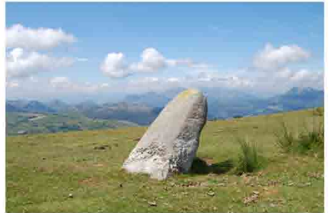
Menhir Alto de Lodos Punto de la ruta: 5,5 km