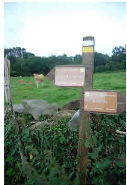
Cruce indicativo Pico de las Nieves Punto de la ruta: 1,5 km