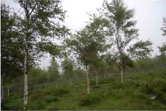
Plantación de abedules Punto de la ruta: 5 km