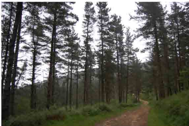
Pista entre pinos Punto de la ruta: 3 km