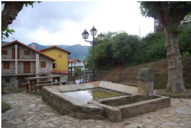
Lavadero de Rascón Inicio y fin de la ruta