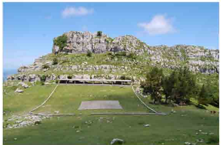
Campa de las Nieves Punto de la ruta: 6 km