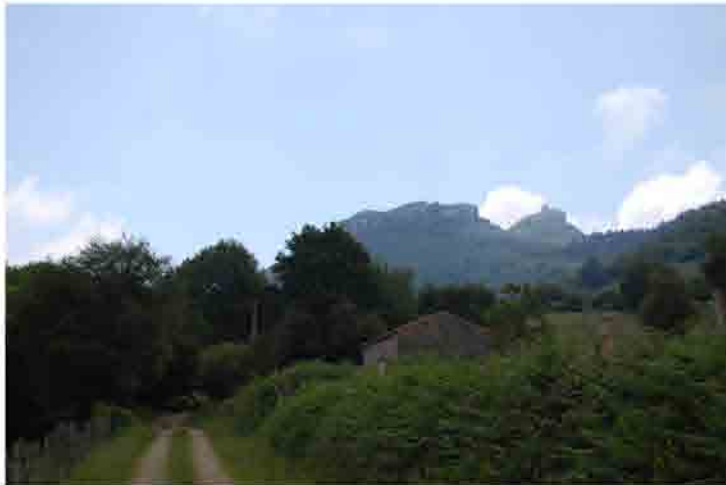
Alejándonos de la ermita Punto de la ruta: 10 km