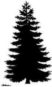
Pino ( Pinus radiata )