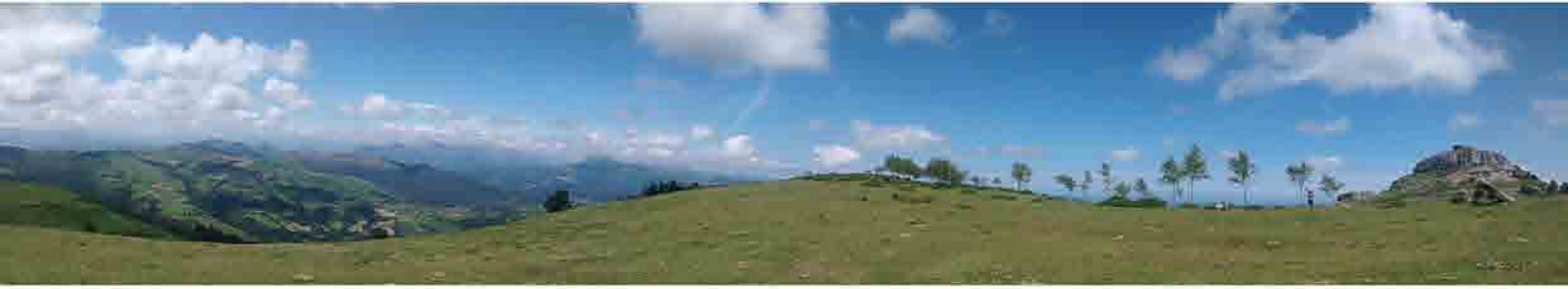
Sendero de descenso hacia Rascón Punto de la ruta: 9 km